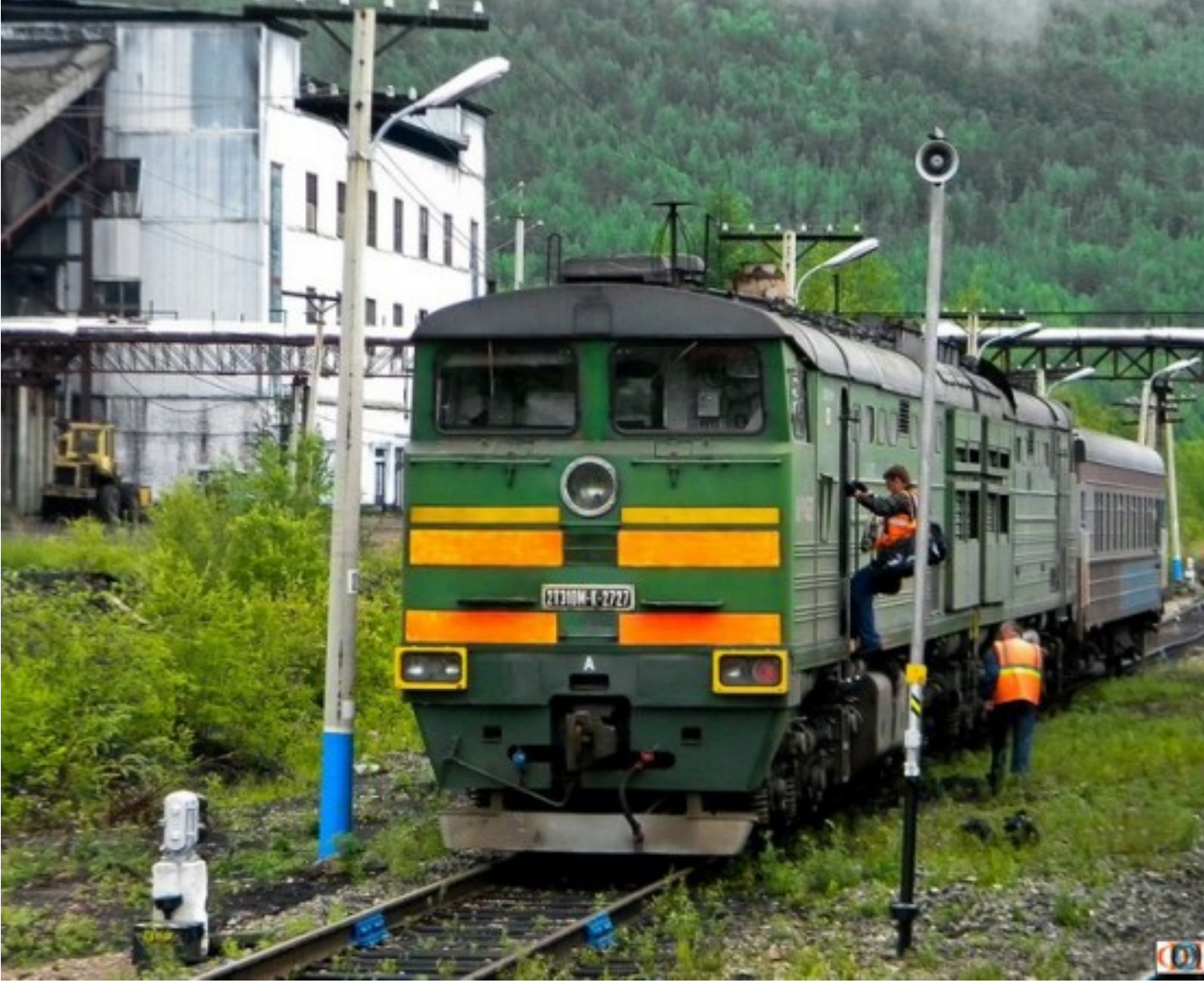
Rusya - Güney Yakutistan'da Khani tren istasyonunda bir tren

Moskova yönetimi, Asya kıtasını Bering Boğazı'nın altından Kuzey Amerika kıtasına bağlayacak bir tren yolu tüneli projesi üzerinde çalışmalara başladı.