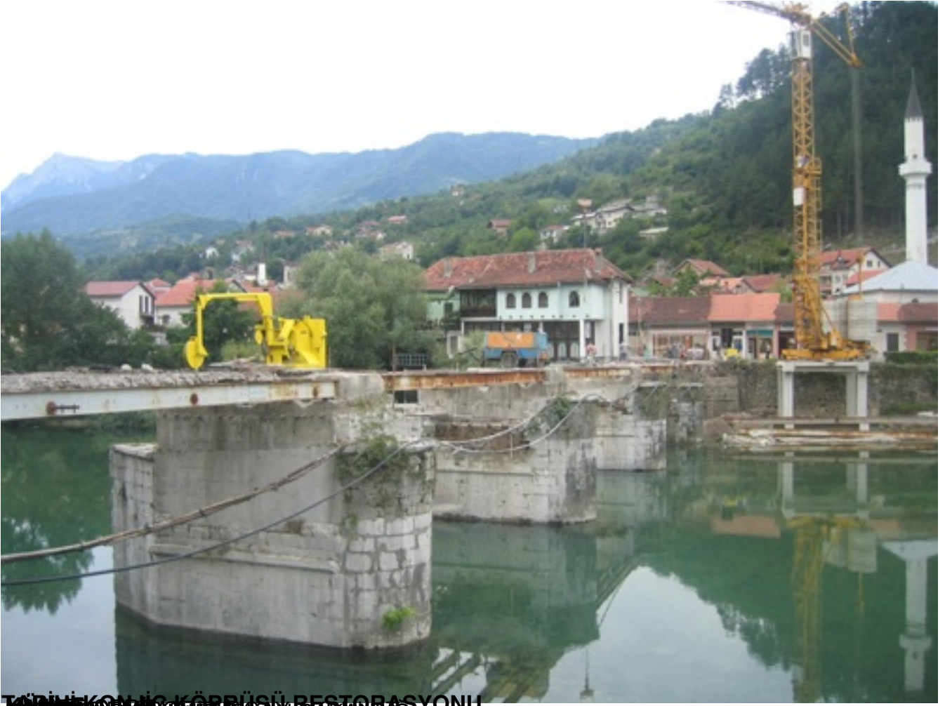
TARİHİ KONJIC KÖPRÜSÜ RESTORASYONU